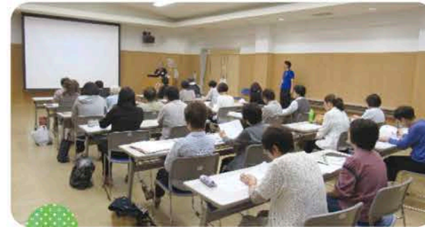
認知症巡回講演会(蒜山) 令和元年 5月27日