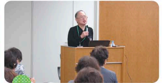
認知症巡回講演会(北房) 令和元年 10月19日