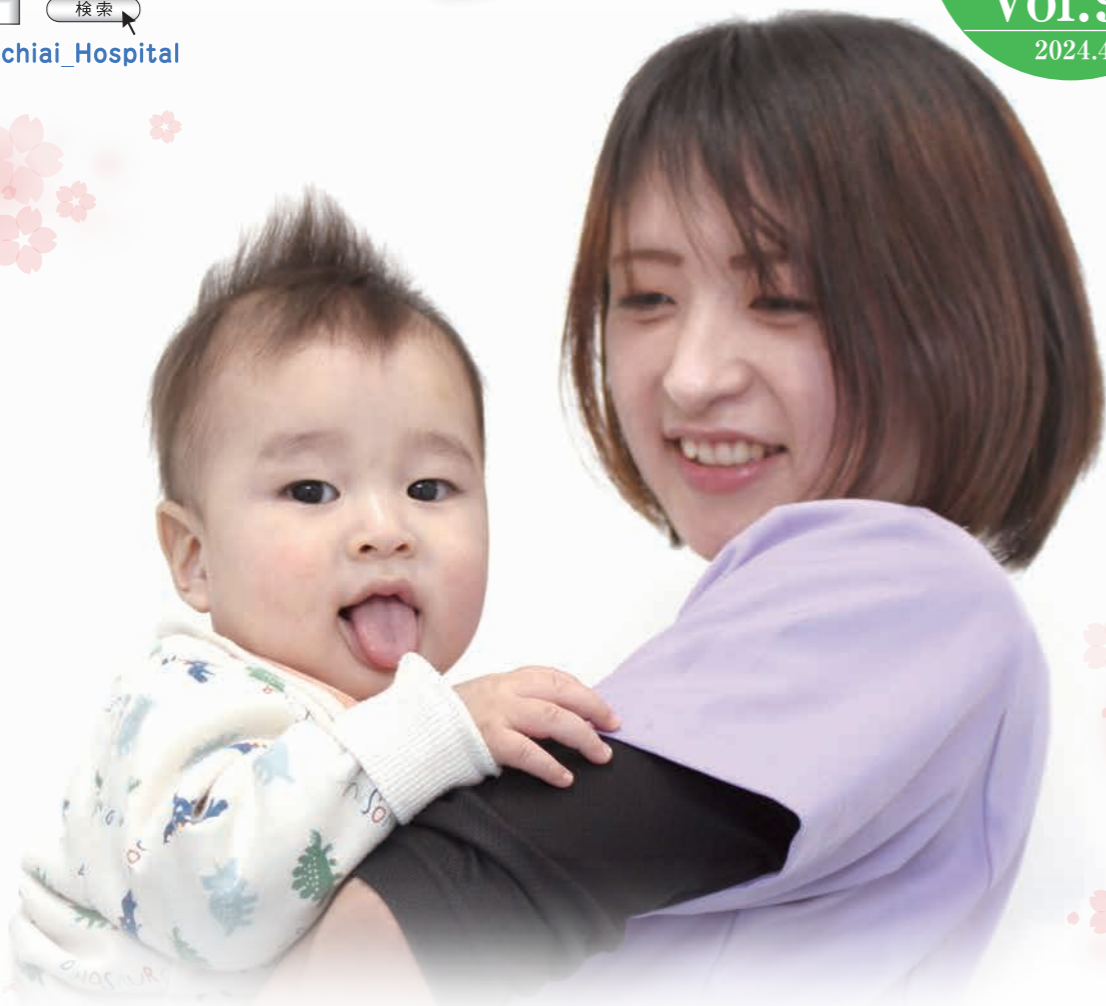
写真/託児所「みどり園」にて