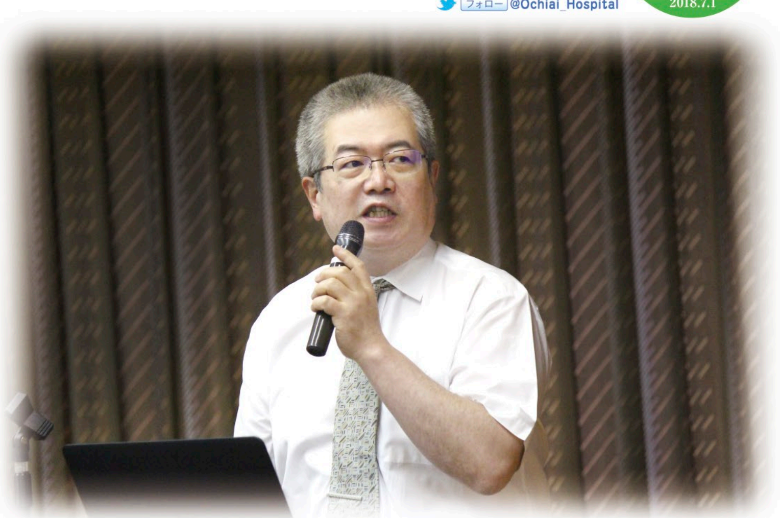
写真/おかやま糖尿病サポーター認定研修会にて

http://ochiaihp.jp 落合病院 検索 フォロー @Ochiai_Hospital