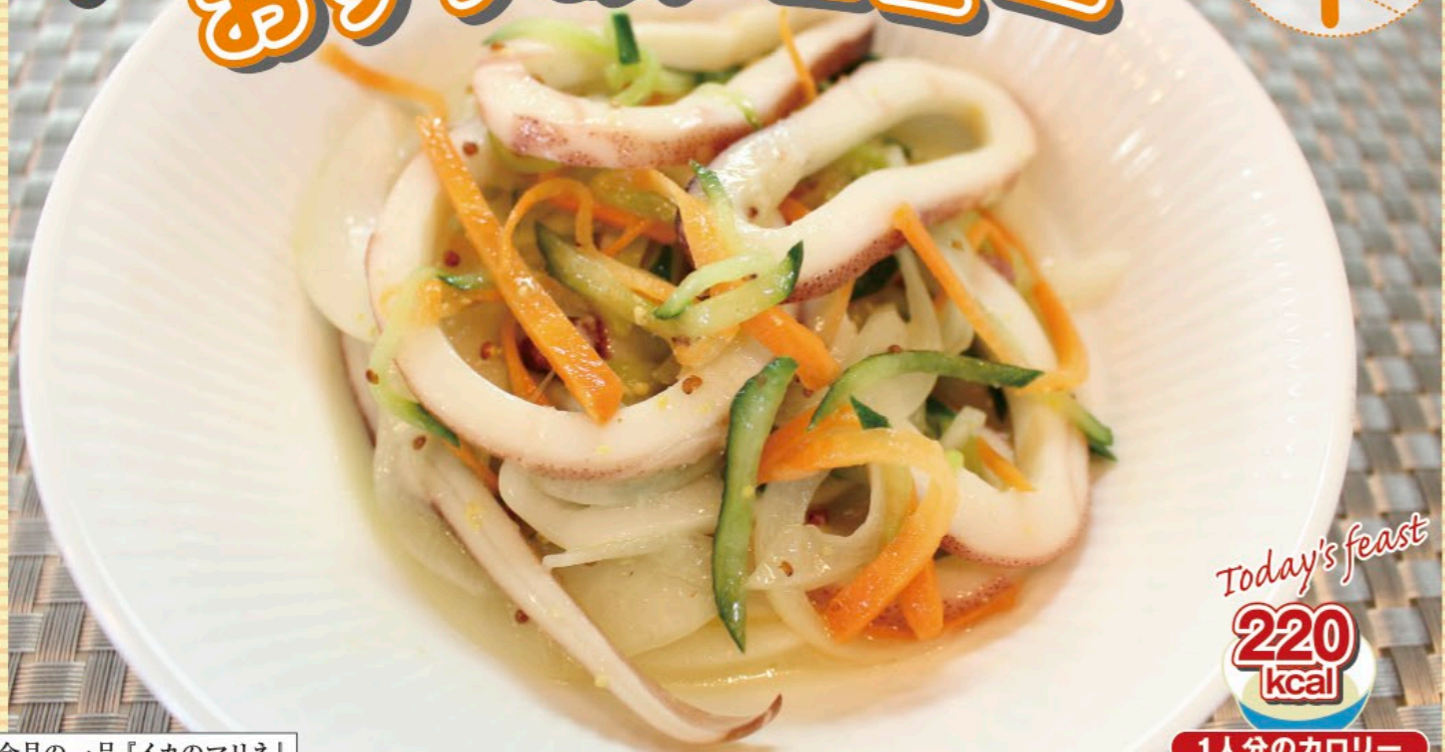
今月の一品「イカのマリネ」