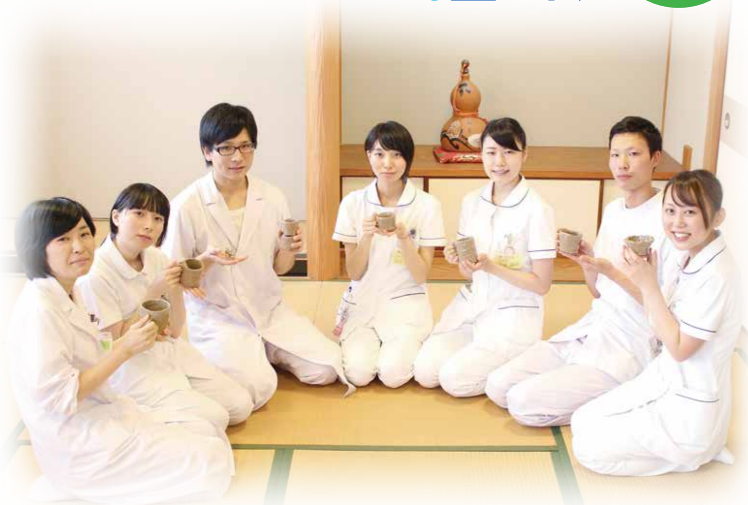
写真/療養病棟「やすらぎ」にて