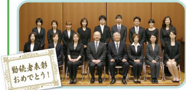
勤続者表彰おめでとう!

東日本大震災における被災者支援活動に対する厚生労働大臣感謝状伝達式 東日本大震災における被災者支援活動に対し、厚生労働大臣より感謝状をいただきました。当院は、震災直後より岡山県医療救護班第5班、第12班として医療救護チーム(各6名ずつ)を派遣し、岩手県大船渡地区の避難所等において活動を行いました。4月25日(金)岡山県庁において感謝状伝達式が執り行われ、受賞した岡山県の災害拠点病院等17団体の代表者が出席し、副知事より感謝状を受け取りました。