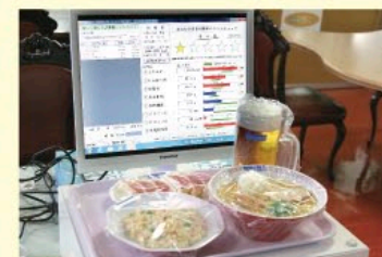
▲コンピューター画面

フードモデルは、見て、触って、直観的に理解することができまるまったく新しい「体験型」の栄養教育システムです。