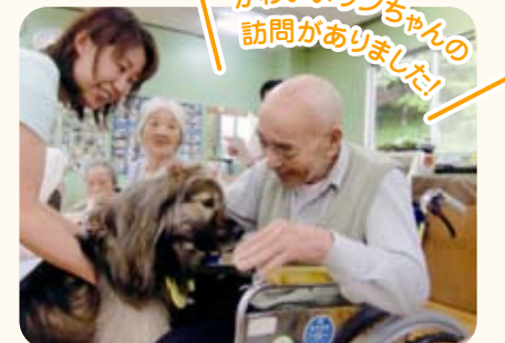
かわいいワンちゃんの訪問がありました!